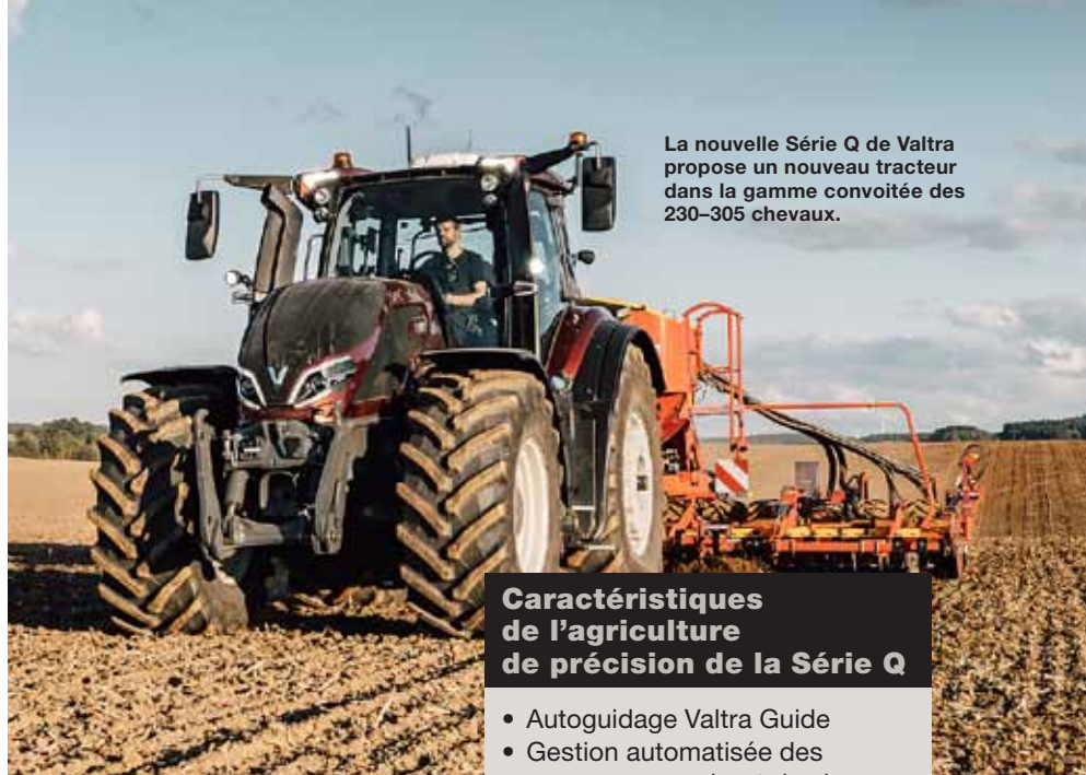
La nouvelle Série Q de Valtra propose un nouveau tracteur dans la gamme convoitée des 230-305 chevaux.

« La Série Q fixe également un certain nombre d'exigences élevées aux concessionnaires. Les techniciens doivent suivre une formation, une gamme déterminée de pièces