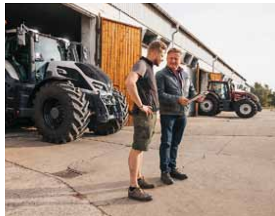
Les clients de la Série Q ont la garantie d'un excellent service de pièces détachées et d'entretien, et d'assistance.

« Par exemple, avec l'autoguidage Valtra Guide associé à la gestion automatisée des manœuvres