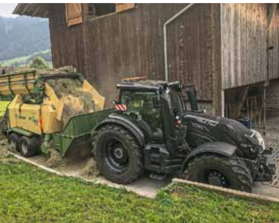
Des balles à la minute : Pressage sur pied directement à partir du râtelier à foin.

« Un aspect que j'apprécie beaucoup. » •