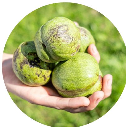
Diese besonders grosse Nussorte wird grün und von Hand geerntet.

Insgesamt stehen heute rund 800 Bäume auf drei Anlagen. 40 bis 50 Jahre können die Bäume stehen, bevor die Leistung zurückgeht. Know-how, Inspiration und Ideen rund um den Nussanbau haben sich Schallers in Frankreich angeeignet – in wenigen Stunden erreicht man vom Berner Seeland das Herz von Frankreichs Nussanbau: Die Nussproduktion hat in der Region Isère rund um Grenoble eine lange Tradition. In diesem Nischenmarkt gibt es nichts nach Norm zu kaufen: Damit die Nüsse bei der Ernte mit