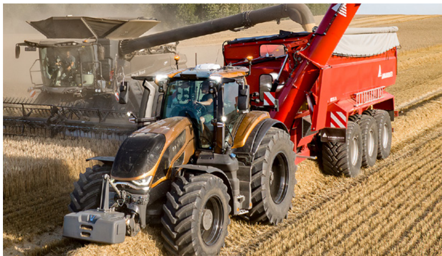
Das neue Design der 6. Generation zeigt sich vor allem bei der Motorhaube.

Mit der neuen Kabine wurden Sicht und Komfort weiter verbessert. Völlig neue Scheinwerfer wurden in die neue Motorhaube integriert.