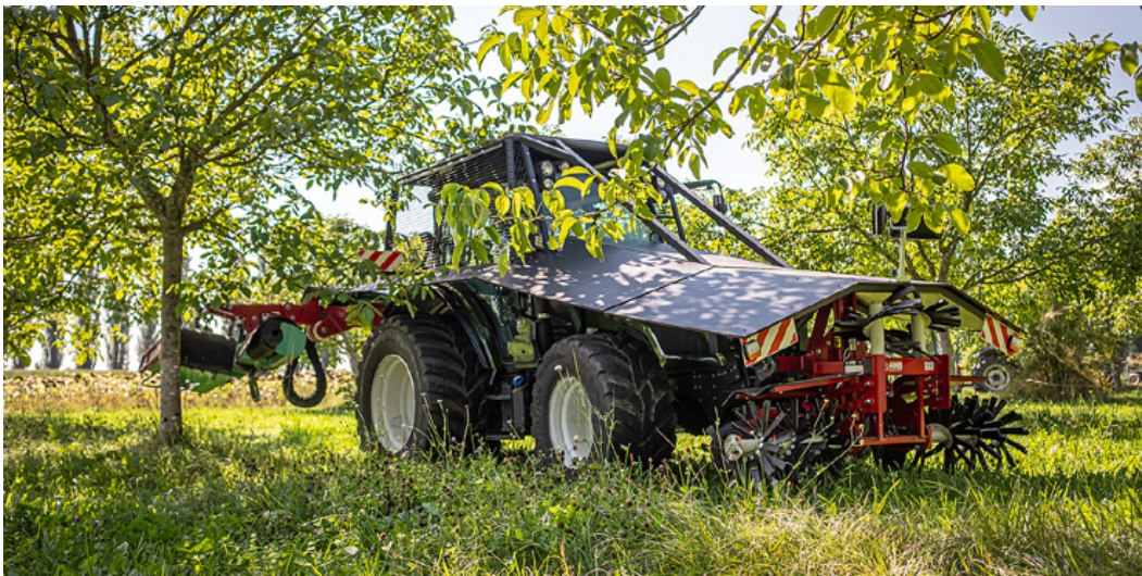
Vom Traktor ist nicht mehr viel zu sehen: Um ihn vor den herabfallenden Nüssen zu schützen (und diese vor den Rädern), wurde der Valtra A134 verschalt.