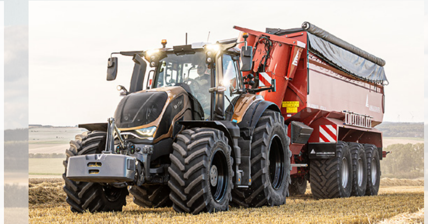
Die neue S-Serie wurde in der Metallicfarbe Amber vorgestellt.

Das elegante Design der neuen Motorhaube optimiert den Luftstrom an der Kabine vorbei. Und der obere