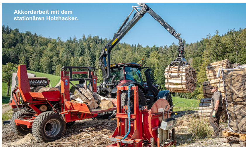
Akkordarbeit mit dem stationären Holzhacker.

«Valtra bietet in dieser Hinsicht mit zusätzlichen Lösungen direkt ab Werk ziemlich viel.» •