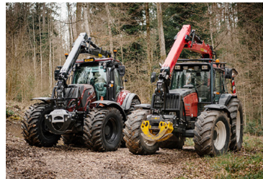
Stabsübergabe: Der neue Valtra T235 Direct löst den Valtra Valmet 8750 ab.