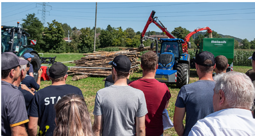
Reges Interesse am beeindruckenden S394.

Farbvarianten und Ausstattungen, darunter natürlich auch die neue Q-Serie, die dieses Jahr in die Produktion aufgenommen wurde. Zu sehen waren ausserdem Lösungen aus dem Unlimited-Studio, die bereits in jedem dritten Valtra-Traktor ab Werk verbaut werden, gerade auch im Kommunal- und Forstbereich. Ausgestellt war zum Beispiel ein Noremat-Mulcher mit im Traktorsystem integrierter Steuerung und ein S394 mit Holzhackler. Valtra liefert mit seinen vielseitig einsetzbaren Traktoren Lösungen für Kompromisse und für jeden Einsatzbereich – das konnten wir unseren Kunden und allen Besucherinnen und Besucher zeigen und lässt die Vorfreude auf die nächste AgriEmotion in zwei Jahren bereits jetzt steigen. •