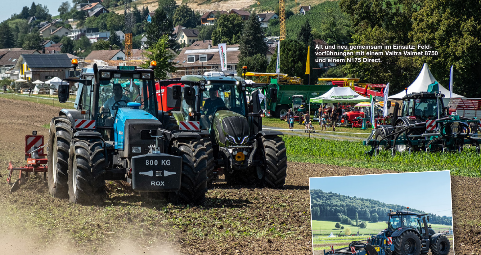
Alt und neu gemeinsam im Einsatz: Feldvorfürhrungen mit einem Valtra Valmet 8750 und einem N175 Direct.