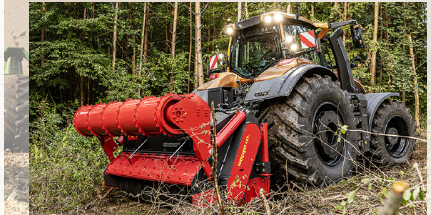
Die S-Serie ist mit der TwinTrac-Rückfahreinrichtung erhältlich. Und Power Boost versorgt die Zapfwelle auch bei den größten Modellen mit voller Leistung.

Lufteinlass gewährleistet saubere Luft für den Motor. Zu den völlig neuen Leuchten in der Motorhaube gehören neben den LED-Scheinwerfern auch LED-Tagfahrleuchten und LED-Arbeitscheinwerfer.