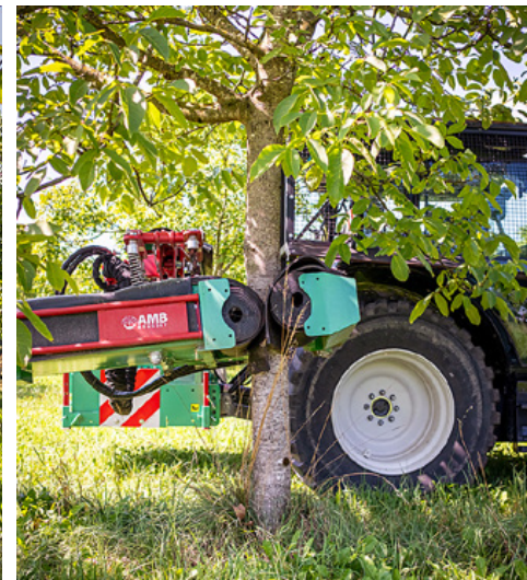
Mit dem am A134 angebauten Baumrüttler verläuft die Ernte deutlich einfacher.

hätte sich gewünscht, mit anderen Produzenten zusammenarbeiten zu können, was aber nicht zustande kam. Mit den Mengen, welche die Familie bald zu verarbeiten hatte, wurden nämlich Investitionen nötig: in eine grössere Wasch- und Sortieranlage und in eine Trocknungsanlage. Dazu kam, dass kleinere Produzenten ihre Ernte bald auch bei ihnen verarbeiten lassen wollten.