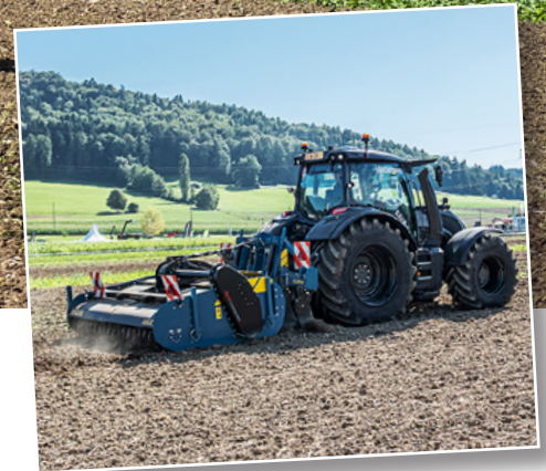
Ein Valtra N175 im Einsatz mit einem Imants-Mulchgerät.